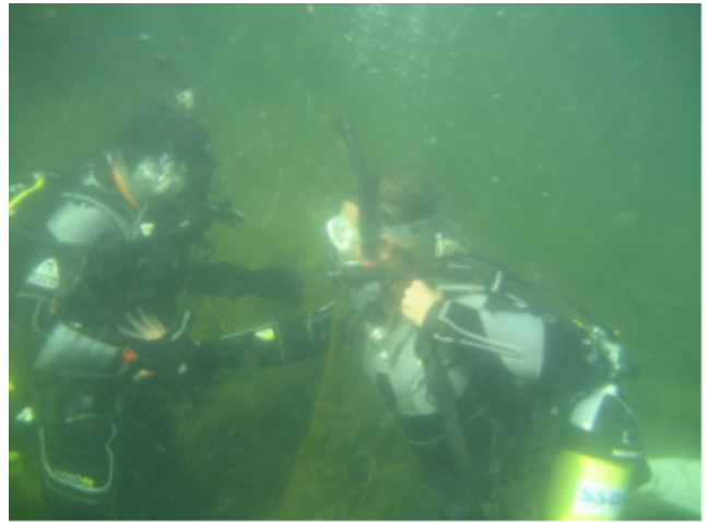
Byte av luftpaket under utbildning

Vi har haft mycket utbildning i klubben på flera nivåer och inom både SSDF/CMAS och PADI. Utbildning inom klubben är viktig både för att få in nya medlemmar men kanske i synnerhet för att få dykare dyka kontinuerligt och fortsätta att utbilda sig. Längre ner i verksamhetsberättelsen presenteras statistik över antalet utbildade.