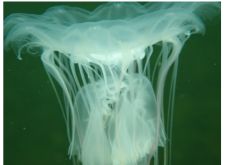
Det var ovanligt mycket maneter 2020.